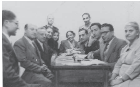
ישיבה של מזכירות מפא"י בתוניס, שנות החמישים

המפלגה הרוויזיוניסטית הוקמה בתוניסיה בשנת 1926, והייתה המפלגה הציונית הראשונה בארצות האסלאם. מבחינה ארגונית היא הייתה זרם חברתי-רעיוני יותר מאשר מפלגה ממוסדת, והפעילות ה"מפלגתית" התרכזה במערכת עיתונה, Le Reveil Juive (להלן: "המעורר היהודי"), שיצא לאור בשנים 1924-1935. מערכת העיתון הייתה התא המצומצם של המפלגה, שם הותוו התכניות ומשם הופצו. הישגה המרכזי היה שכל נציגי תוניסיה לקונגרסים הציוניים בשנים 1927-1933 היו רוויזיוניסטים. פעילותה לא החליפה את הפעילות הציונית המסורתית של האגודות הציוניות ושל תנועות הנוער.