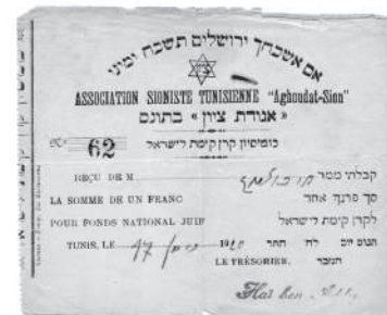
קבלה על תרומה (בסך של פרנק אחד) לקרן הקיימת לישראל באמצעות "אגודת ציון" בתוניס, 1920