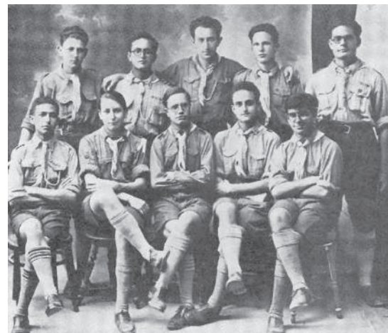
קבוצת הבוגרים הראשונה של תנועת השומר הצעיר, תוניס, ראשית שנות השלושים

ממייסדי השומר הצעיר בתוניסיה בראשית שנות השלושים, ממקימי "חוג יום חמישי", חוג ציוני רעיוני ומהפעילים ב"גדוד הקרן הקיימת". למד בצרפת הנדסת אלקטרוניקה בשנים 1935-1937. התנדב לצבא הצרפתי, לחיל הקשר. שירת לסירוגין בשנים 1939-1945. שימש מזכיר הקרן הקיימת בתוניסיה בשנים 1945-1949. בשנת 1949 עלה לארץ והתיישב בקיבוץ כפר מנחם. בשנות השמונים של המאה העשרים יזם בארץ את כינוסי יוצאי תנועות הנוער בתוניסיה. ספר זיכרונותיו על פעילותו בשומר הצעיר: תולדות השומר הצעיר בתוניסיה , גבעת חביבה 1980.