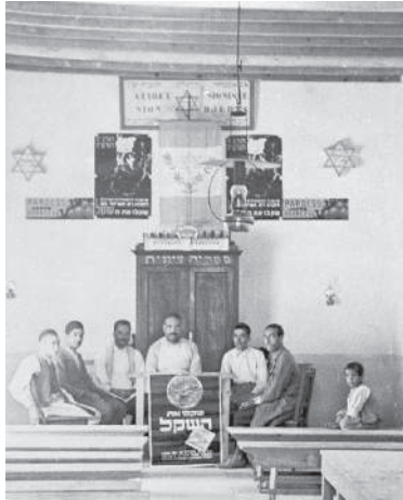
ישיבת הוועד המנהל של אגודת "עטרת ציון" ג'רבה, 1930

הוא הדוחף הנוער שלנו לחיים חדשים שלא הורגלנו בהם לא אנו ולא אבותינו [הכוונה להכשרה, ח"ס] [...] הנוער שלנו תשעים למאה מתרחק מהחינוך הצרפתי המכניסו לאפיקי חיים נרחבים לתרבות מודרנית מתבוללת ומסתפקת בחיים יהודיים צרים ובחיי עבודה ועמל [...] התקווה לעלייה לארץ ולחיים יהודיים בארץ הם התריס הגדול בפני התרבות המתבוללת האירופאית.