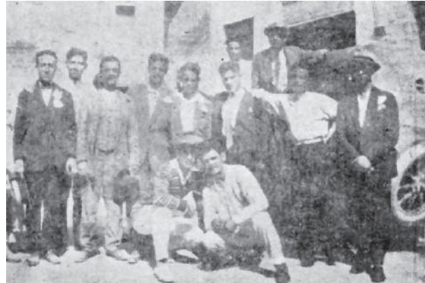
טויל בנאבל של חברי אגודת "יושבת ציון", בשנת 1923