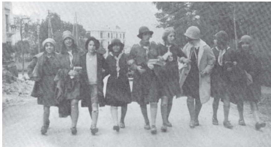
קבוצת "סנונית", חניכות בתנועת השומר הצעיר בתוניס, ראשית שנות השלושים