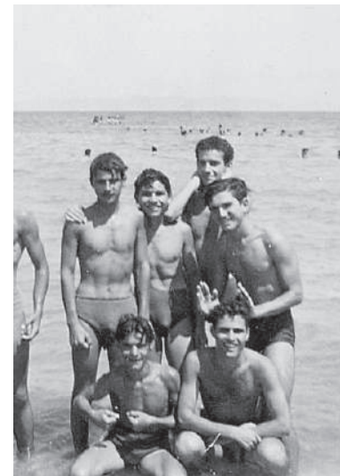
קבוצת חניכים של תורה ועבודה ובני עקיבא בחוף הים, 1952

היהודים בגירבה והסביבה הם כולם דתיים במאה אחוז, מלבד הבתי הספר הישנים בתור "חדרים" ללמוד התנ"ך, התלמוד וכל חלקי התורה, עוד פתחנו "שעורי-ערב" ללימוד השפה העברית המודרנית והציונות וידיעת הארץ [...] רק רצון העלייה לארץ