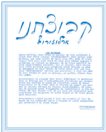
קבוצתנו ארלוזורוף, עיתון אחת הפולגות של "צעירי ציון" בתוניס, 1945