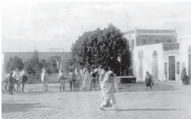
כיכר בית הכנסת, בן-ג'רדאן, 1916

מבוסס על הטבלה אצל הטל וסיטבון, עמ' 291-295, x אין נתונים. -- אין יהודים