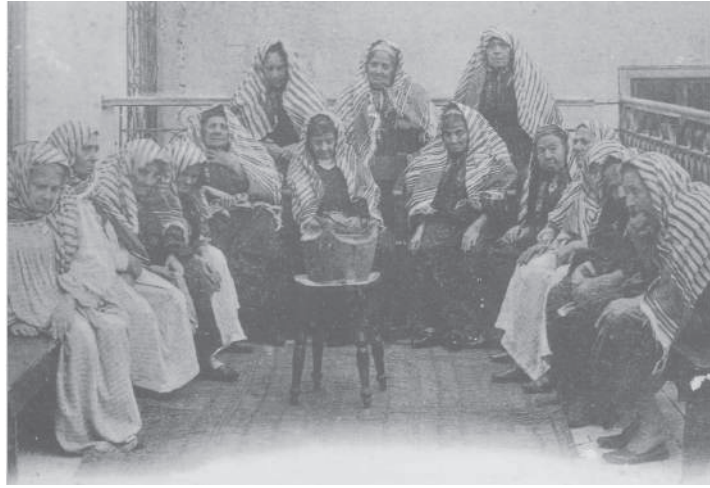
בית אבות יהודי לזקנים ולנכים, תוניס, בערך 1900

אחיד בכל קבוצות האוכלוסייה. בקרב הצרפתים היה הריבוי הטבעי קטן, כמקובל בחברות מודרניות; בשאר הקבוצות הוא היה גדול יותר.