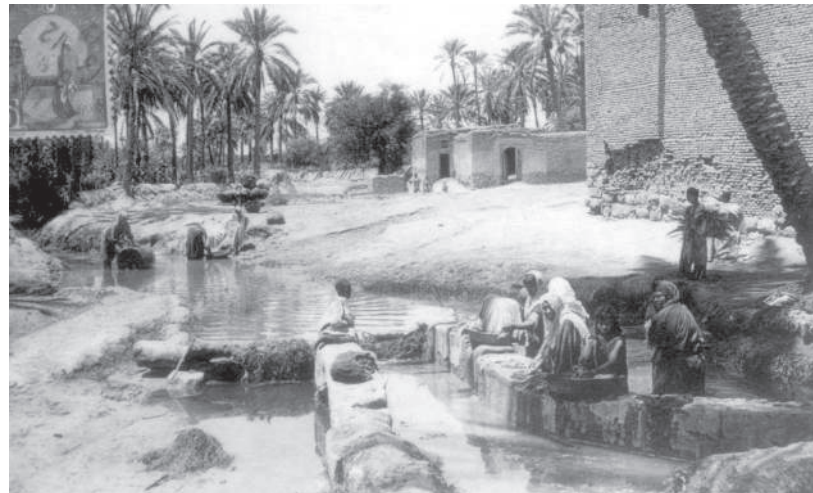
נשים יהודיות כובסות בנחל, תוזר, 1912

[...] במרחק שתי שעות מן העיר לרוח דרומית מזרחית עומד כפר דענעד [דגת]. חמשים משפחות מבי" [מבני ישראל] נמצאו שם ויש להם בית הכנסת קטן, ובמרחק חצי שעה מהכפר יש לעדה הזאת עוד ביהכ"נ אחר ישן נושן, אשר יקראוהו בשם "גרעבע" [אלגריבה] [...]. במהלך שני ימים מצערבי אצל הים עומדת עיר קאבעס [גאבס] ושם יגורו לערך מאה משפחות מבי". [...] במהלך חצי שעה משם נמצא כפר סארא [ג'ראע?] ושם חמשים משפחות מבי" [...] הנני להזכיר בזה עוד איזה מקומות אשר לא בקרתיים בעצמי אך הגד הוגד לי אודותם מפי אנשים נאמנים: במרחק שלשה ימים מקאבעס נמצאת במדבר כבדת ארץ נושבת נקראת "איסריט" [?] והיהודים קוראים לה "ארץ-התמרים" על דבר המון עצי תומר הגדלים שמה. בארץ הזאת יש כמה ערים,