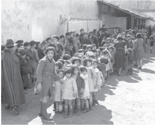
תינוקות מגן הילדים "Nos Petits" [פּוּטִינֵן] עומדים בתור לקבל מתנות פורים. חניכי תנועת הנוער U.U.J.J. (בתלבושת צופית) מלווים את הילדים; תוניס, בערך 1935