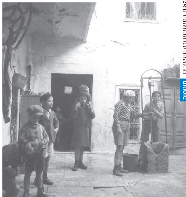
ילדים יהודים בחצר פנימית של בית בחארה, תוניס, שנות השלושים של המאה העשרים

בתוך כמאה שנים חוותה יהדות תוניסיה גידול דמוגרפי מואץ ודלדול מהיר לא פחות. בראשית הכיבוש הקולוניאלי (1881) מנתה הקהילה כ-25,000 נפש, וערב מלחמת ששת הימים (1967) היה מספרה דומה. משקיף זר עלול להתרשם כי לא חל שינוי בגודלה במאה שנים אלה – ולא היא. כמו ברוב ארצות האסלאם התמעטה האוכלוסייה היהודית במחצית השנייה של המאה העשרים. הקהילה היהודית עמדה בפני סיום קיומה בארץ זו. התמורות הדמוגרפיות בקהילה היהודית בתוניסיה היו: גידול דמוגרפי, הגירה מיישובים קטנים אל העיר, שינוי בגודל המשפחה היהודית, עלייה בתוחלת החיים וברמת החיים ושינוי דפוסי הקיום. הנתונים על המאה העשרים טובים למדי ומאפשרים התחקות אחר תהליכים אלה. ייחודה של הקהילה היהודית התוניסאית היה בשלוש תת-קבוצות האוכלוסייה שהרכיבו אותה: יהודים איטלקים, יהודים צרפתים ויהודים תוניסאים. כל אחת מהן עברה שינויים דמוגרפיים פנימיים, ובמקביל התרחשו שינויים גם ביניהן.