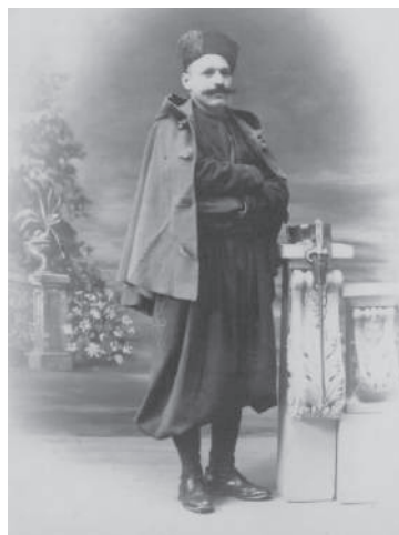
מתנדבים יהודים לצבא הצרפתי במלחמת העולם הראשונה

הצו הראשון שאפשר ליהודים להתאזרח ניתן ב-28 בפברואר 1899. הוא התיר להעניק אזרחות למי ששירת בצבא הצרפתי, לבעלי משרה ציבורית ששכרה שולם בידי האוצר הצרפתי או למי ששירת את צרפת שירות מיוחד. הגדרות אלה התאימו רק למיעוט שבמיעוט. בלחצם של היהודים פורסם ב-3 באוקטובר 1910 צו נשיאותי, ולפיו תוענק