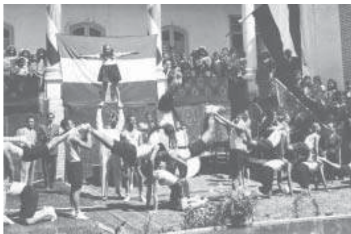
אירועי ספורט במסגרת הפעילות הציונית, טהראן, 1948

באיראן. במשך ימי הוועידה הותוו יסודות "החלוץ" באיראן. הוועידה הביעה תמיכה ב"חלוצים" המעפילים בכל הדרכים לארץ ישראל, שלחה ברכות ל-11 היישובים החדשים אשר הוקמו בנגב במוצאי יום הכיפורים, ביקשה מההסתדרות הציונית לשלוח מורים לאיראן להפצת השפה העברית ותרבותה בקרב הנוער היהודי, ולהכשירו לעלייה. בעקבות הוועידה הראשונה נפתחו בערי השדה סניפים נוספים של "החלוץ". בשנת 1947 פעלו 15 סניפים של התנועה, שלושה מהם בטהראן ו-12 בערי השדה, ובהם כ-2,000 בני נוער. תנועת "החלוץ" עוררה התנגדות מסוימת בקרב ההנהגה הציונית הוותיקה, שחששה לאבד את שליטתה בתנועה הציונית. כמו כן הייתה התנגדות כלפיה בשכבות עממיות