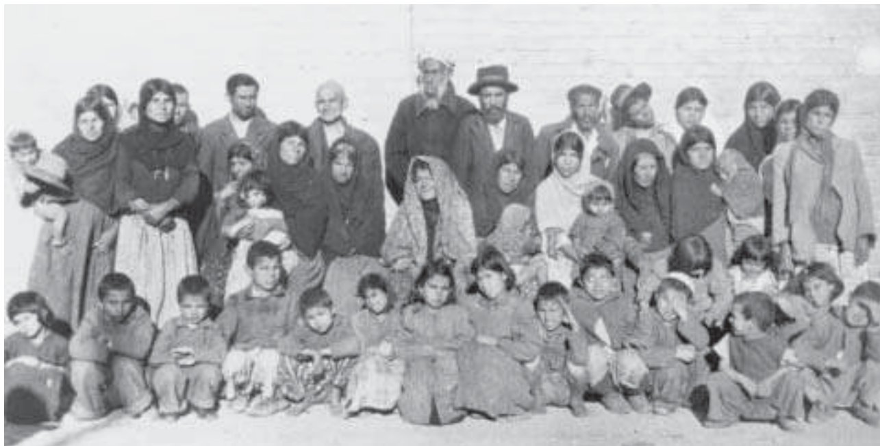
פליטים יהודים, תושבי מחנה המעבר בטהראן, מארס, 1955

ללא קורת גג וללא בגד חם לחורף הקשה בטהראן. רוב היהודים מערי השדה התרכזו במחלה והגדילו את הצפיפות שהייתה שם ממילא. מספרם הגדול של הפליטים משך את תשומת לבם של האוכלוסייה המוסלמית ושל הממשלה האיראנית. זו חששה מכל שינוי שעלול לגרום לתסיסה ולמהומות בטהראן. שליחי העלייה, ובראשם ציון עזרי, יצאו לערי השדה לשכנע את היהודים לא לצאת לטהראן ולהישאר במקומותיהם, שם יטפלו בהם ויכינו אותם לעלייה. היהודים העשירים מטהראן ומהערים האחרות העדיפו בשלב זה להישאר באיראן.