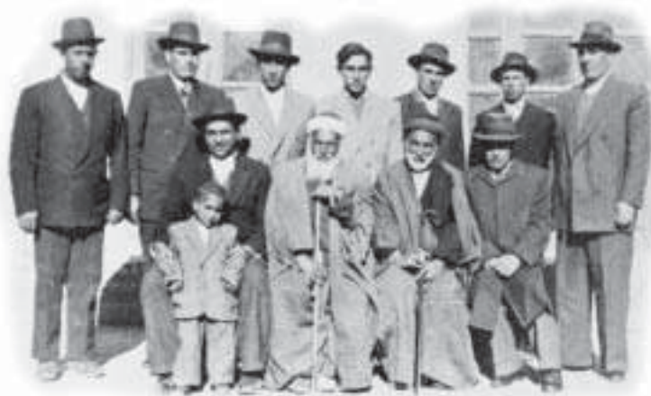
הוועדה לענייני עלייה בכרמאן, 1950

ובסדרי העלייה משליחי המוסד לעלייה, שבעיקרם היו חברי קיבוצים של מפא"י ומפ"ם, לשליחי מחלקת העלייה שהיו מהמפלגות הדתיות בארץ, התנהלה במתח רב. משנת 1953, לאחר שעלו רוב המועמדים לעלייה והלחץ בטהראן פחת, הכינו שליחי העלייה את רשימת המועמדים לעלייה בצורה מסודרת יותר. בערי השדה הקימו ועדות עלייה שתפקידן היה לפרסם את עניין העלייה בקהילה היהודית, לערוך מיון ראשוני של המעוניינים לעלות ולסייע בבדיקות הרפואיות ובהעברתם של העולים לטהראן לקראת העלייה לישראל.