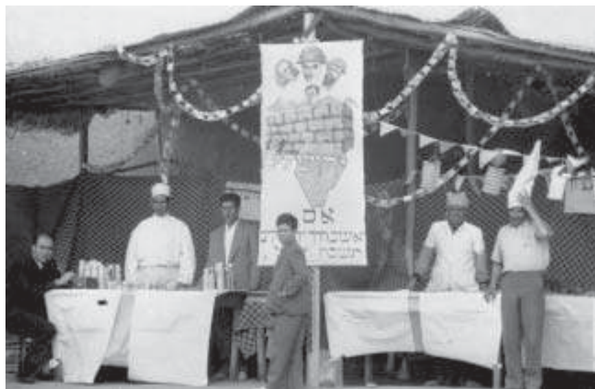
אוהל שהוכן ליום העצמאות במחנה המעבר של העולים מעיראק בבית העלמין בטהראן, 1950

לטהראן. בחודש מאי 1950 דווח מטהראן על 2,700 יהודים שהגיעו מפרדסתאן. זה היה הרקע להקמת "מחנה ב'".