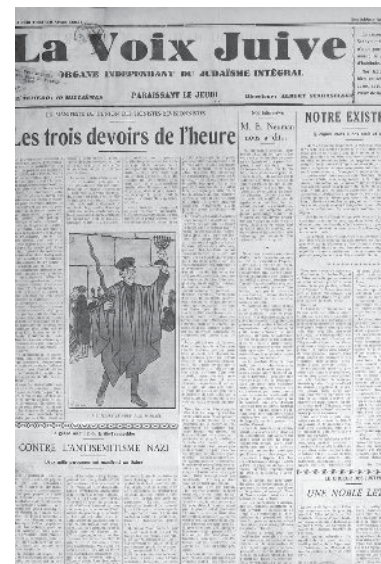
שער השבועון הרוויזיוניסטי La Voix Juive (הקול היהודי). במרכז: דיווח מהקונגרס הציוני השמונה-עשר בפראג – "פראג תקוות ואשליות". קהיר, גיליון מיום 30 באוקטובר 1933