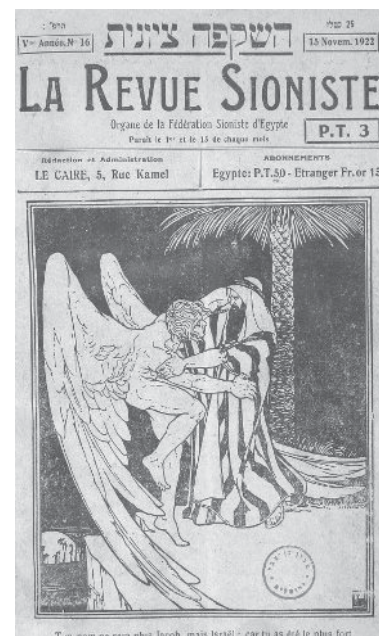
שער השבועון La Revue Sioniste (השקפה ציונית). במרכז ציור המתאר את יעקב נלחם במלאך האלוהים. על פי בראשית לב, כח-כט, נוסף לשמו השם ישראל מלשון שרה – נלחם וניצח – לאחר שניצח את מלאך האלוהים. קהיר, גיליון מיום 27 בנובמבר, 1922

ממחקר השוואתי למיעוטים אחרים במצרים מתברר שהיהודים הוציאו כתבי עת יותר מהמיעוטים האחרים, ובהם הקופטים, היוונים והסורים. ההסבר לכך הוא מורכב. נראה