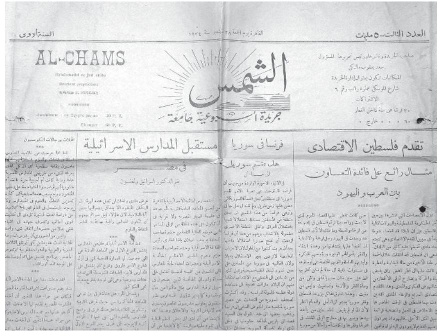
שער השבועון אלשמס (השמש). במרכז: כתבה על עתיד בתי הספר היהודיים במצרים. קהיר, גיליון 5, יום שישי, 28 בספטמבר 1934

היהודי מאלכי החזיק שני דגלים בו בזמן: קריאה מתמדת להשגת עצמאות מלאה למצרים, ובמקביל פעל נמרצות להקמת בית לאומי ליהודים בארץ ישראל. אלשמס הבלטי את השתתפות היהודים בחיי הכלכלה במצרים כגון היענותם לתרום בעין יפה לקרן ההגנה הלאומית (1937), פנה במכתב גלוי לראשי הקהילה לתרום לחידוש ציודו של צבא מצרים (אפריל 1939) ואף דיווח על נכונותם של יהודי מצרים להשתתף במאמץ הזה (מאי 1939). ההתקרבות לחברה המצרית לא סייעה לאלשמס לשרוד במלחמת העצמאות של מדינת ישראל. בשל דעותיו המנוכרות ותמיכתו בהקמת בית לאומי בארץ ישראל תקף גימאל אלחוסייני, מזכיר הוועד הערבי העליון בפלשתינה, בנובמבר 1947 את אלשמס וכתב באלהגראם: "אין סיכוי רב שהתעמולה הערבית הפלשתיאית תגשים את יעדיה במצרים כל עוד יוצא לאור במצרים העיתון הציוני אלשמס". במאי 1948 הגישה הליגה הערבית בקהיר תלונה לשלטונות נגד השבועון בטענה שבעליו תקף את הליגה וקרא לתמוך בציונות, וכי כתב העת קיבל מימון מהתנועה הציונית לכיסוי הוצאותיו. תגובת השלטונות לא בוששה לבוא: ב-11 ביוני 1948 הוציאה הצנזורה במצרים צו סגירה והחרימה את כל גיליונותיו של אלשמס.