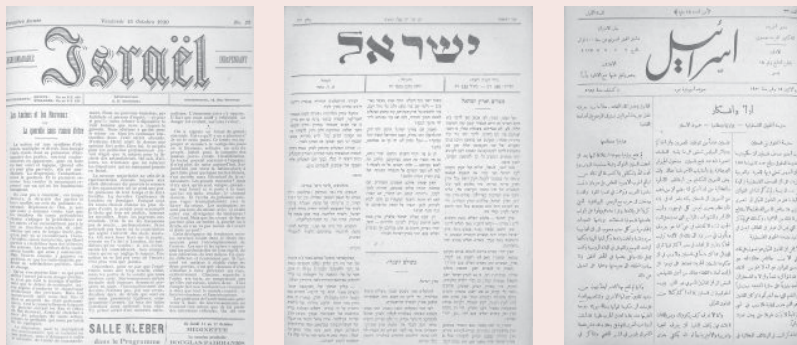
שלושה עשרים מתוך השבועון הציוני ישראל מימין: בערבית (גיליון 33, יום שני, 15 בנובמבר 1920, ד' בכסלו תרפ"א); באמצע: בעברית ("ח" בכסלו תרפ"א); משמאל: בצרפתית (15 באוקטובר 1920)