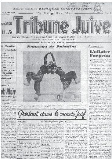
שער השבועון La Tribune Juive (הבמה היהודית). במרכז: צילום צמד הרקדנים הורנטטיין מתל-אביב. קהיר, גיליון מיום ה-24 במרס 1936

ישראל חדל להופיע ב-14 ביוני 1939, אך למעשה התמוז עם שבועון ציוני אחר – La Tribune Juive – שנוסד באלכסנדריה שלוש שנים קודם לכן. זה היה העיתון הבולט ביותר של יהודי מצרים בשפה הצרפתית בשנות הארבעים. הוא שימש במה למסריה של התנועה הציונית ותמך בהקמת בית לאומי לעם ישראל. גם בימיו הקשים, עם עליית כוחן של התנועות הפאן-אסלאמיות במצרים כגון "האחים המוסלמים" ו"מצרים הצעירה",