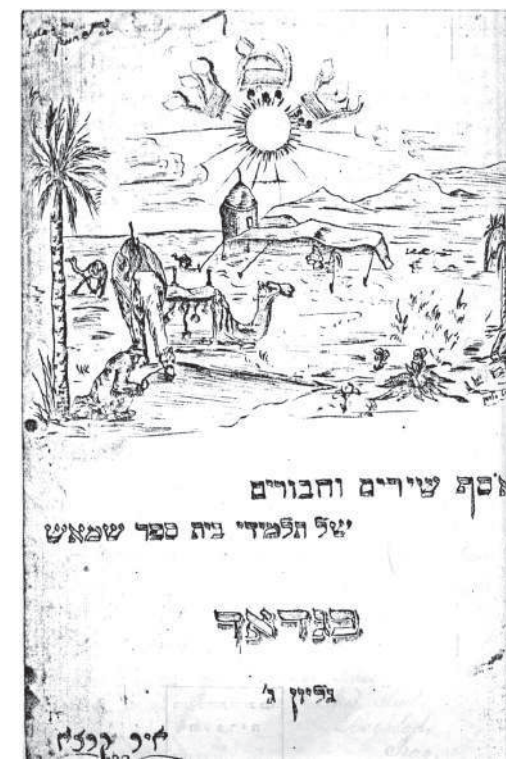
נוף מדברי בשער הגיליון השלישי של שמש , העיתון הפנימי בעברית של בית ספר "שמאש", בגדאד, אייר תרצ"א, 1931

המאמר הראשי של הגיליון הראשון מיום 10 באפריל 1924 נכתב בערבית רוטה ושופעת אופטימיות פטרויטית עיראקית, שהייתה שונה מהסגנון הערבי הבלתי תקני של התקופה העות'מאנית, אשר גבל בשפה המדוברת ונכתב באותיות עבריות. במאמר זה פירט העורך את הסיבות להופעת העיתון: א. אמונתם של העורכים שהספרים, העיתונים וכתבי העת המדעיים הם האמצעים הטובים ביותר להתפתחות אומות, עמים וקהילות על ידי הארת המחשבה והרחבת האופקים. ב. מתיחת ביקורת על הפגמים החברתיים והמוסריים. ג. עידוד הנוער לכתובה ספרותית ומדעית. ד. הידוק הקשרים בין הסופרים "הישראלים", כלומר היהודים ושאר הסופרים בעיראק, ואיחוד מאמציהם בתחומי הספרות והמדע כדי לסייע לתחייה