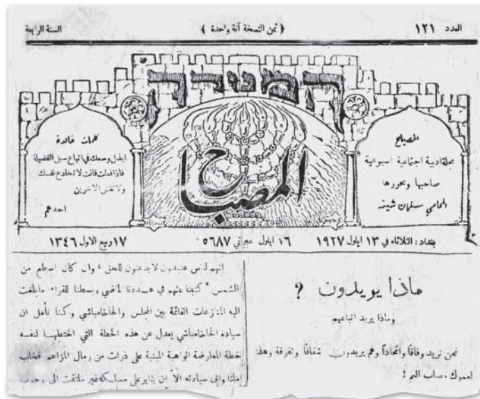
שער השבועון אלמצבאח (המנורה), 13 ספטמבר 1927 בכותרת העיתון נרשמו גם התאריכים: ט"ז באלול תרפ"ז, 17 רביע אלאלול 1346 להג'רה.

למרות עמדותיה המתונות של עורך אלמצבאח , והצהרותיו החוזרות ונשנות על נאמנותה של הקהילה היהודית למולדת העיראקית, לממשלות עיראק ולבית המלוכה האשמי בראשותו של פיצל הראשון – ליבתה את הקנאות הדתית והלאומנית. היהודים נחשבו לתומכי הבריטים, הואשמו בסיוע להקמת המפעל הציוני בארץ ישראל, וזהו עם הציונות ונחשדו כגיס חמישי, משום שהיו גורם מתחרה ומאיים על המשורת הממשלתית ועל הכלכלה והתרבות בעיראק. התמיכה בציונות שגילה השבועון בראשית דרכו עשתה אותו טרף קל ללאומנים הקיצוניים. העורך עמד חסר אונים אל מול האווירה המתלהמת בעיראק שהציתו המאורעות בארץ ישראל באותה שנה, ואשר הביאה לסגירתו של העיתון.