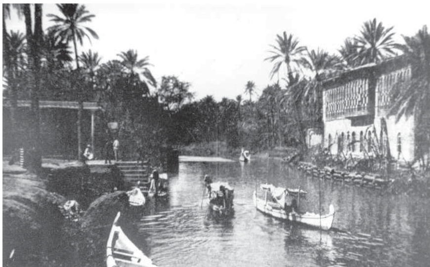
נמל בצרה, המחצית הראשונה של המאה העשרים

במוצל הייתה הקהילה היהודית הגדולה ביותר של צפון עיראק. לפי הערכתו של בנימין השני חיו בעיר בשנת 1848 450 משפחות. על פי האומדן הבריטי משנת 1919 חיו בה 7,635 יהודים, ואילו במפקד של 1947 נמנו 10,345. מעמדה של מוצל נפגע לאחר פתיחת תעלת סואץ והיא ירדה מגדולתה כעיר מרכזית בדרך המסחר להודו; כתוצאה מכך היגרו יהודים מעיר זו לבגדאד ולאירופה, אך היא המשיכה להיות אבן שואבת ליהודים שהיגרו אליה מכפרי הסביבה.