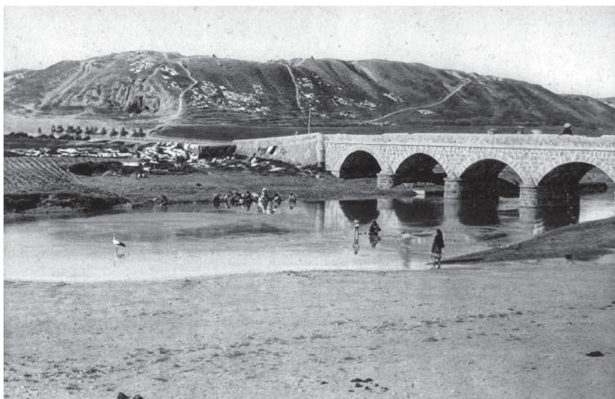
מבט אל מוצל, המחצית הראשונה של המאה העשרים משמאל לגשר – חורבות העיר העתיקה נינוה, בירת אשור הקדומה ואחת הערים החשובות במזרח הקדום.