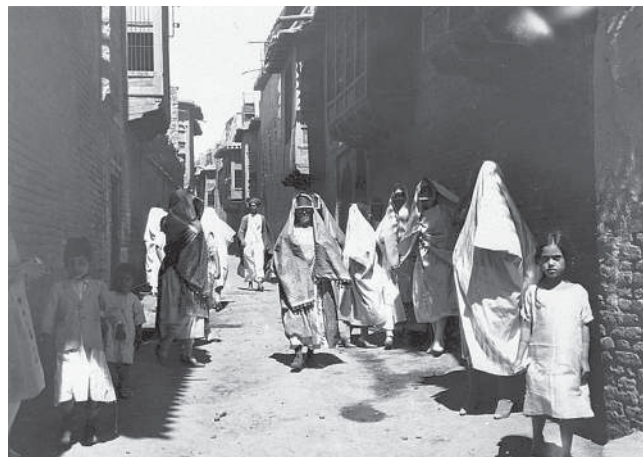
סמטה ברובע היהודי (אלמחלה) של בגדאד, המחצית הראשונה של המאה העשרים

הנתונים על מספר היהודים עד שנת 1947, השנה שבה התקיים מפקד האוכלוסין הראשון בעיראק, מתבססים על הערכות בלבד,