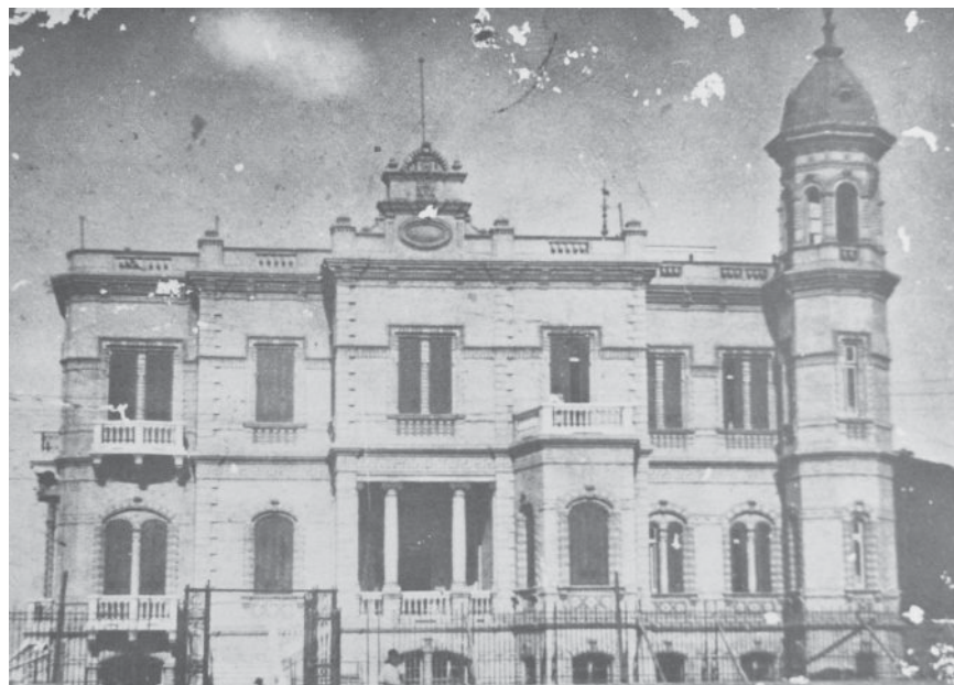
אחד מבתי יהודי טנטא העשירים

יהודים ב-1833, ואילו ב-1907 נותר בה יהודי אחד בלבד. בלוח 8 מתוארות מגמות אזוריות שונות באוכלוסייה היהודית שמחוץ לקהיר ואלכסנדריה. אזור תעלת סואץ קיבל תנופה הודות לפעילות שמסביב לעורק התחבורה החשוב שנפתח ב-1869. במיוחד התפתחה פורט סעיד שבקצה הצפוני של התעלה, ובה האוכלוסייה היהודית שמנתה יותר מ-1,000 נפש ב-1927. יהודי פורט סעיד שהתרכזו ברובע האירופי של העיר היו יוצאי עדות שונות: תימנים, תורכים, ספרדים ויוצאי רוסיה ורומניה. הקהילה,