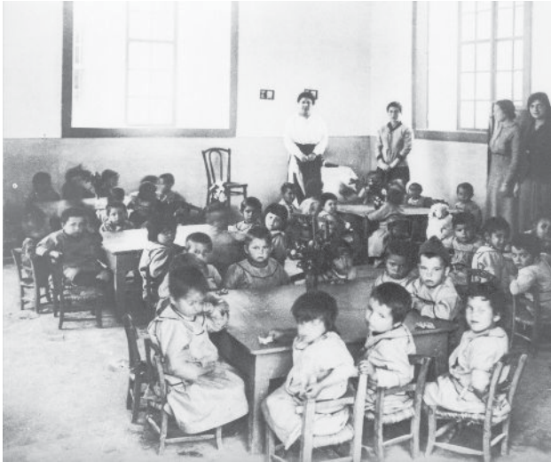
גן ילדי המגורשים מארץ ישראל. אלכסנדריה, 1916