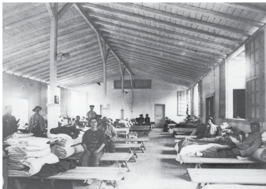
מגורשים מארץ ישראל באחד ממחנות הפליטים באלכסנדריה, 1916 לערך

בנתונים המפורטים על תפרוסת יהודי אלכסנדריה ניכרים הבדלים בהשוואה ליהודי קהיר. תנאי הצפיפות המרביים בקהיר בתקופת מלחמת העולם הראשונה כבר לא היו באלכסנדריה, אך שיעור היהודים מכלל התושבים היה לרוב גבוה יותר בעיר הנמל