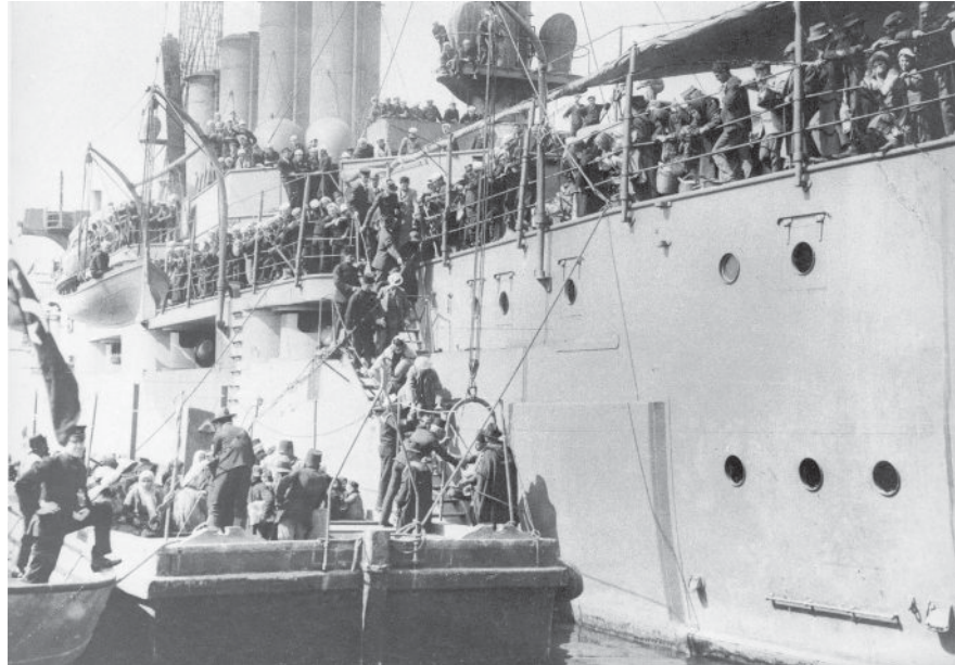
מגורשים מארץ ישראל על סיפון האנייה "טנסו" בהגיעם לנמל אלכסנדריה, 1915 לערך

ב המקור לשנים עד 1948: מספר העולים לארץ ישראל לפי שנת העלייה על פי רישום התושבים, 1948. הלשכה המרכזית לסטטיסטיקה, רישום התושבים, 1950.