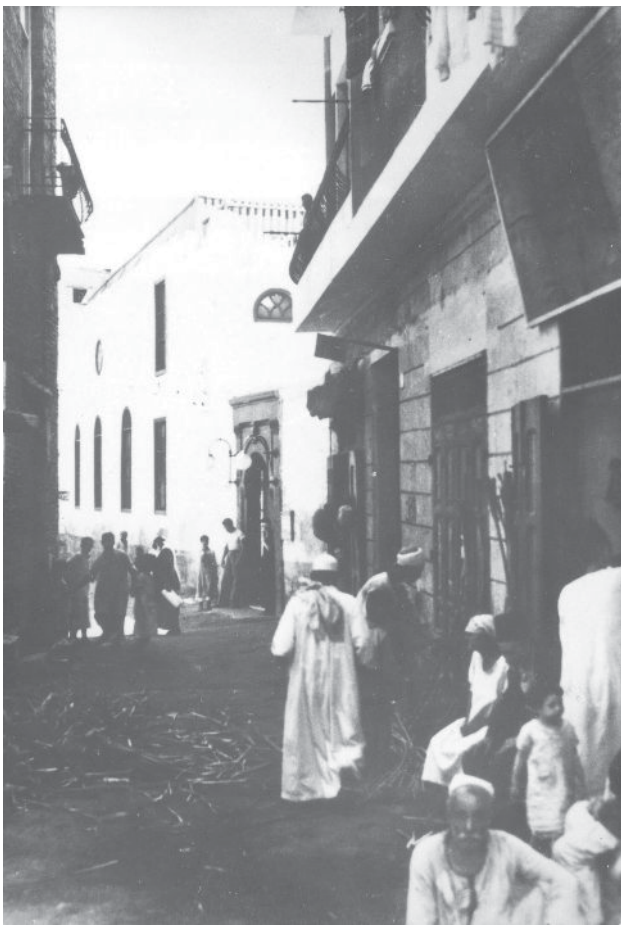
חארת אליהוד, הרובע היהודי הישן בקהיר, 1920

בתקופת מלחמת העולם הראשונה גם בגידול זמני במספר היהודים ביישובים קטנים רבים מחוץ לשתי הערים הראשיות. תהליכי העיור הכלליים והיהודיים התחזקו בין שתי מלחמות העולם. משקלן של שתי הערים הגדולות מתוך כלל אוכלוסיית מצרים עלה לכ-12% ב-1927, ב-16% ב-1947 וב-19% ב-1960. התבססותה של קהיר כבירה מנהלית וכמרכז גדול למסחר ולצריכה הביאה לגידולה המהיר ביחס לערים אחרות במצרים. בקרב היהודים בלטה קהיר עוד יותר כמרכז העיקרי. כל גידול האוכלוסייה היהודית התרכז בה, ותגבורות אוכלוסייה באו גם מאלכסנדריה ומשאר היישובים. מספר היהודים בקהיר גדל מ-29,207 ב-1917 ל-41,860 ב-1947, אז מנתה הקהילה קצת פחות משני שלישים מכלל יהודי מצרים. מספר היהודים באלכסנדריה היה יציב ונטה לירידה קלה עד לערב מלחמת העולם השנייה; ירידה רבה יותר חלה במהלך המלחמה. גודל הקהילות ביישובים האחרים שבהם היו יהודים הצטמצם בהתמדה. אחרי 1948 פחתה האוכלוסייה היהודית כמעט באותה מידה בכל מקום, אף כי בקהילות הקטנות הייתה הירידה חזקה יותר יחסית.