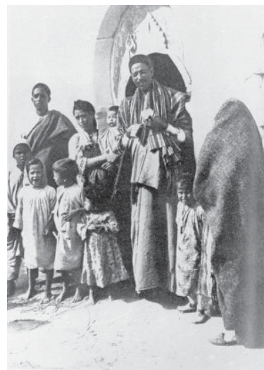
משפחה יהודית (משמאל) בחברת שכנים ערבים בפתח ביתה בכפר, לוב 1936