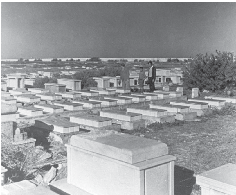
קבר אחים לקרבות הפרעות של 1945 בבית הקברות של טריפולי, 1945

בניגוד להצהרות של הבריטים נראה שהפרעות אכן תוכננו. אמנם הפורעים באו רובם מקרב ההמון, לא רק בטריפולי, אלא גם מהעיירות ומהכפרים סביב, אך נמצאו עקבות לגורמים לאומניים בטריפוליטניה, ובייחוד למפלגה הלאומנית (אלח'זב אל'ט'ני). מה גם שבתים וחנויות של לא יהודים בעיר העתיקה בטריפולי סומנו לקראת הפרעות, וידוע שחנותו של אחד הסוחרים הערבים בעיר שימשה מטה לפורעים. חלק נכבד מפעילי מפלגה זו חזרו ללוב רק זמן קצר לפני כן, עם הכיבוש הבריטי, לאחר שגורשו בידי האיטלקים בזמן המרד הערבי ושהו מחוץ ללוב. שם, בעיקר במצרים, ספגו