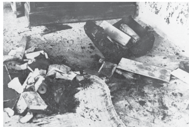
בית הכנסת גרבי מיד לאחר אירועי יוני 1948 טריפולי, יוני 1948

המאורעות החמורים בשנות הארבעים ובראש וראשונה הפרעות שהתרחשו בשנת 1945, והיציאה ההמונית של היהודים את לוב מעוררים את שאלת הידרדרות מצבם של היהודים בלוב. האם ניתן לדבר על הידרדרות מתמשכת, ואם כן מהי ראשיתה ומהם מרכיביה? כפי שהוסבר לעיל, מקורות שונים מלמדים על ההפתעה וההלם שגרמו לכאורה הפרעות. בדברים להלן ניתן