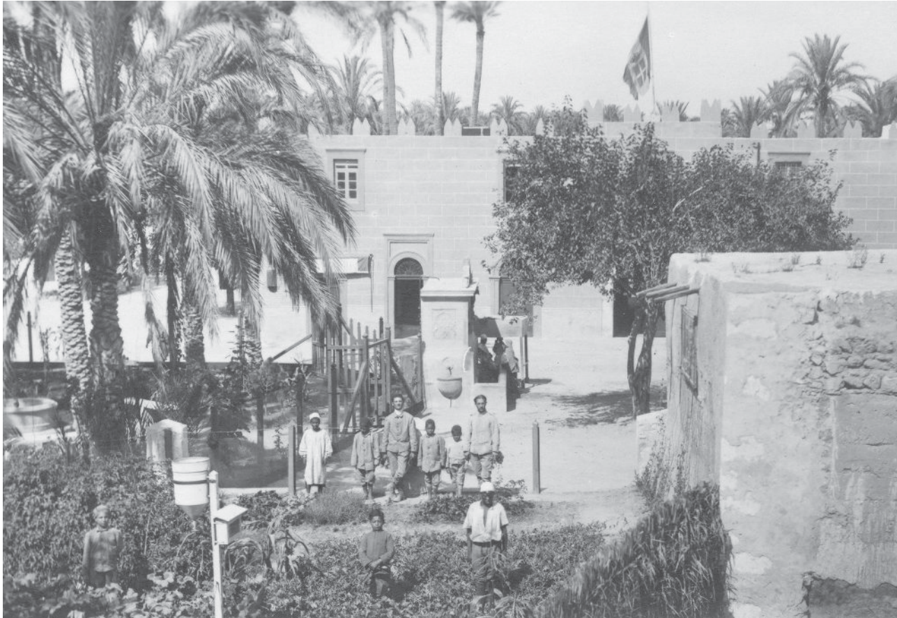
זמור, שנות העשרים או השלושים של המאה העשרים

בתיים לשרוף את החפצים לטהרת הנקיון. המחלה [נ]משכה שני חדשים. מתו בהם מן היהודים סך 470 נפש, אך הנק(י)בות שלטה בהן המחלה יותר מהזכרים. גם בשנת התרע"ב פרצה מחלת המגפה מסרחון החליים הנופלים במלחמה, מהמושלים מתו המון רב, לא ימד ולא יספר. גם היהודים לא נקו מהמגפה, כי מתו מהם מתי מספר. ימי המחלה לא משכו כל כך, יען הממשלה האיטלקית נלחמה גם עם המגפה ותגרש אותה כליל.