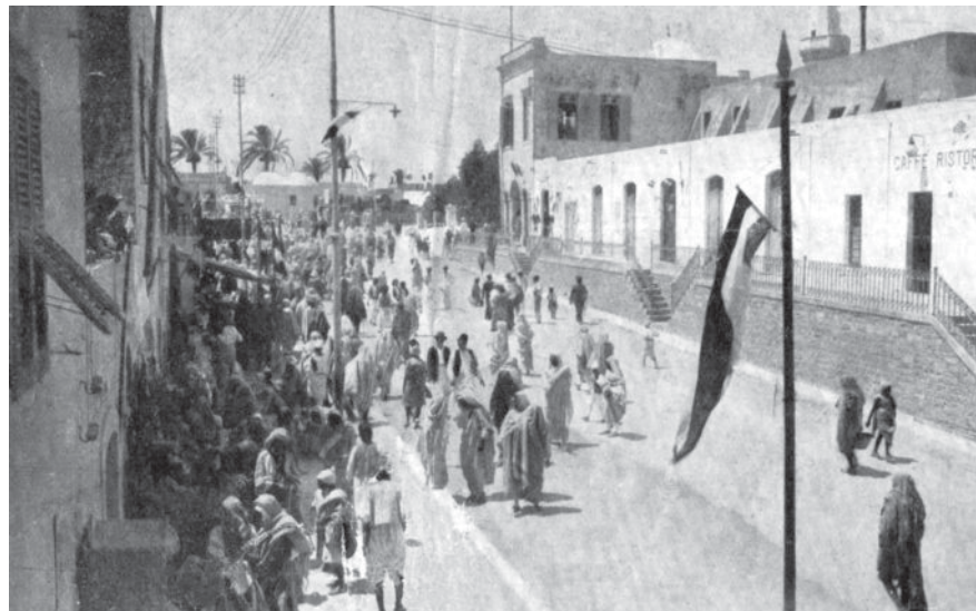
רחוב בעיירה כ'ומס, ברקע המסגד, שנות השלושים של המאה העשרים