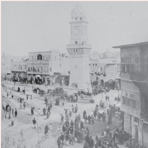
תושבי חלב מתאספים לקבל את פני פיצל. אוקטובר 1918

הבדל דת. סעיף אחד מבין תשעת סעיפי ההסכם עסק בסיועה של התנועה הציונית למדינה הערבית למיצוי הפוטנציאל הכלכלי הגלום באוצרותיה הטבעיים של הארץ, ולפיתוח אפשרויותיה הכלכליות [...] בשולי הדברים הוסיף פיצל הערה בזו הלשון: