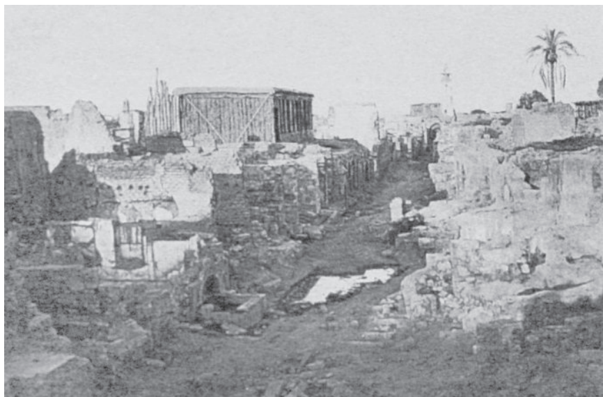
בתים הרוסים ברובע הנוצרי בעקבות התפרצויות אלימות של מוסלמים. דמשק, 1860

סולטאן עות'מאני בשנים 1839-1861. עלה לשלטון בגיל 16, אחרי המפלה שספגה תורכיה מידי מחמד עלי. אלמג'יד נאלץ להתמודד עם מרידות רבות בתחומי האימפריה. הוא פתח את "תקופת הרפורמות" בתולדות האימפריה העות'מאנית לאחר פרסום כתב הרפורמות "כִּיִּשִׁי שְׂרִיף" בנובמבר 1939, שבו הצהיר על שוויון בפני החוק לבני כל הדתות. בשנת 1841 פרסם, לבקשת משה מונטיפיורי, פרמאן, ובו אסר על העלאת עלילת דם נגד היהודים בתחומי ממלכתו.