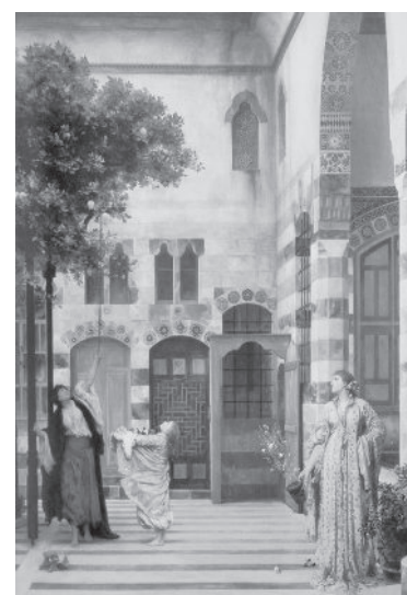
ציור שמן המתאר נשים עוסקות בקטיוף לימונים בחצר "בית פֶּאָרְחִי". דמשק, 1873

מצב דואלי זה של אוטונומיה עדתית-דתית ושגשוג חלקי, מחד גיסא, ושל נחיתות והשפלה, מאידך גיסא, אפיין את יהודי סוריה עד לשנות השלושים של המאה התשע-עשרה. כך למשל בחלב, בדמשק ובעכו מילאו יהודים תפקידים בכירים בתחומי מסחר ובנקאות מסורתית, במשרות מנהליות-פיננסיות ובממשל המקומי. בני משפחת פֶּאָרְחִי – בעיקר שאול ובניו חיים ורפאל – החזיקו במשרות בכירות של ניהול וייעוץ פיננסי בדמשק ובעכו, ששימשו מרכזים של המחוזות העות'מאניים בסוריה הגדולה; בדמשק השתתפה משפחת פֶּאָרְחִי אף במימון שיירת החג' (העלייה לרגל) השנתית למכה ולמדינה. חיים פֶּאָרְחִי שימש יועץ פיננסי ומנהלי של אֶחְמַד אֶלְגִ'זָּאָר פֶּאָשָּׂא, המושל האכזר של מחוז צידון שבירתו הייתה עכו, ומי שהצליח ב-1799 להדוף את המצור של נפולאון מעכו. לאחר אלג'זאר, בתקופת שלטונו של סֶלִימָאן פֶּאָשָּׂא (1804-1818) בעכו, מילא חיים פֶּאָרְחִי תפקידים פיננסיים ומנהליים בכירים ביותר, למגינת לבם של יריביו הנוצרים, שאחד מהם אף תיאר בהגזמה את מעמדו: "חיים היהודי מחזיק בכל מוסרות השלטון ועושה מה שחפץ. אומרים כי איש יהודי שולט במוסלמים ונוצרים, בבכירים ובזוטרים, בקרובים וברחוקים בחופש מלא". (המקור בערבית. א' אלעורה, תאריך' ולאית סלימאן באשא אלעאדל , צידון 1936, עמ' 471).