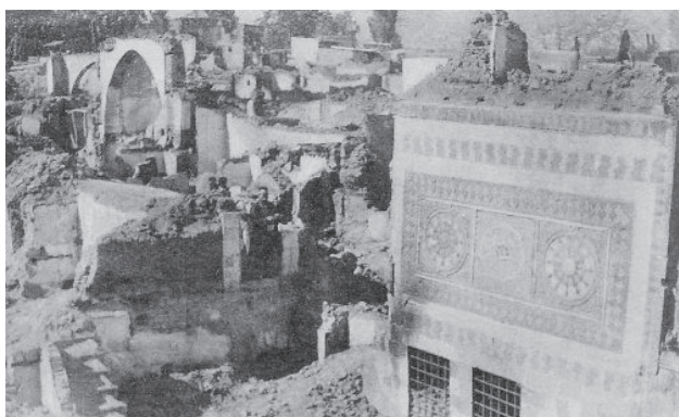
הרס כללי בעקבות הפצצת דמשק על ידי הצרפתים ב־18 באוקטובר 1925 בתגובה למרד הדרוזים