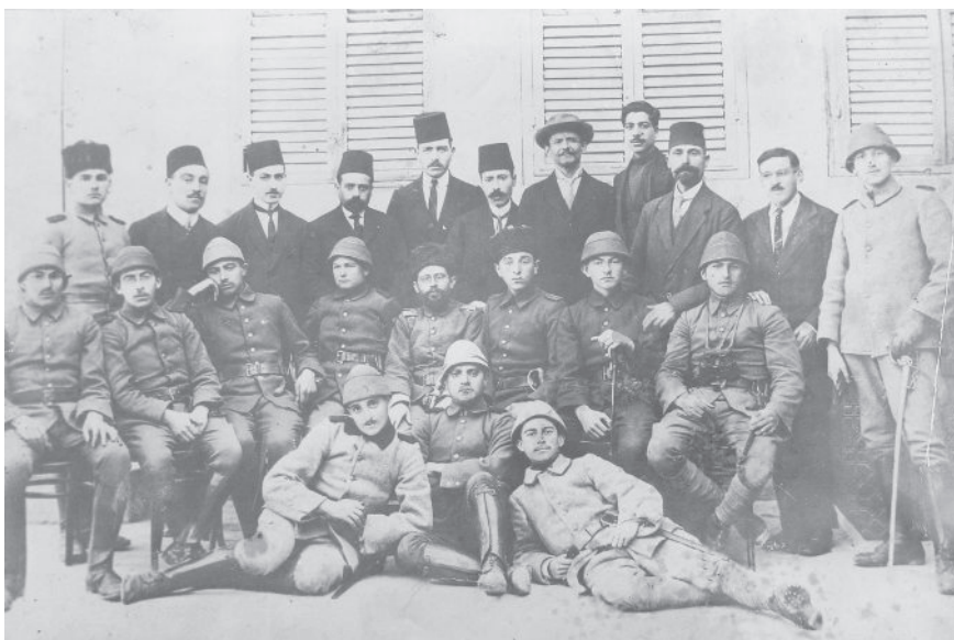
חיילים ארץ-ישראלים בצבא העות'מאני וביניהם משה שרת (שורה שנייה שלישי משמאל) בחברת נכבדים מקהילת חלב. חצר בית החולים של חברת "צדקה ומרפא", 1915

למרות ניסיונות של משכילים נוצרים לעצב תנועה לאומית ערבית על-עדתית, היחסים הבין-עדתיים לא השתנו שינוי רב: מוסלמים המשיכו להיות עוינים כלפי נוצרים, ונוצרים כלפי יהודים, ולהפך. יחס המוסלמים ליהודים היה עדין דואלי: סובלנות יחסית מחד גיסא, ובוז והשפלה מאידך גיסא. אולם בקרב היהודים הסתמנה מגמה של שערוב –