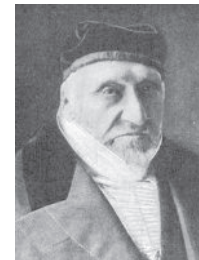
משה מונטיפיורי (1784-1885)

גם לאחר 1840 המשיכו בני ההמון המוסלמי, וללא ספק הנוצרי, להציק ליהודים בעטייה של עלילת דמשק ועלילות נוספות שטפלו עליהם. אולם השלטונות העות'מאניים, שכבשו מחדש את סוריה בעזרת אנגליה ומעצמות אחרות בשלהי שנת 1840, גינו את עלילת הדם ושיקמו את מעמדם המועדף, יחסית לנוצרים, של יהודי סוריה. על פי בקשת משה מונטיפיורי, הנדבן היהודי הבריטי, הוציא הסולטאן עבד אלמג'יד בנובמבר 1840 פְּרִמָּאן, צו מיוחד שגינה את עלילות הדם של דמשק (ורודוס), הגדירן כדיבה והבטיח הגנה ליהודי האימפריה.