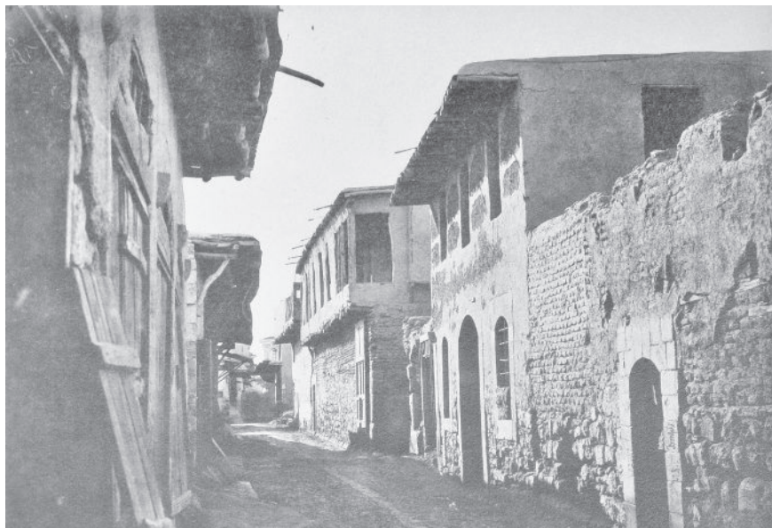
קטע מתוך "הרחוב הישר" המפריד בין בתי היהודים לבתי הנוצרים בדמשק, 1868

במקרים מסוימים סבלו יהודים ונוצרים מפשוטי העם מפגיעות של ההמון המוסלמי – אשר אילץ אותם ללכת במקום שבהמות הלכו, לטאטא רחובות, לשאת משאות לא להם ולספוג מכות גופניות. כדי להימנע מכל אלה נזקקו לפעמים בני עדות החסות לחסות בצלם של תקיפים מקומיים תמורת תשלומים קבועים. משתי עדות החסות, היהודים והנוצרים, יחסם של מוסלמים ליהודים היה בדרך כלל טוב מיחסם לנוצרים, שהיו רבים מהיהודים ומונותאיסטים פחות מהם, ונחשדו בקשרים עם מעצמות אירופה הנוצרית שסיכנו כביכול את המדינה המוסלמית.