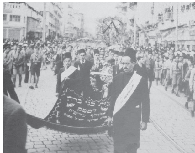
למעלה מימין: השתתפות בני הקהילה היהודית בלויית הנשיא תאג' אלדין. דמשק, 1943