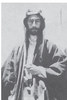
פיצל הראשון (1883-1933)

בן למשפחה התאשמית ששלטה בחג'אז שבחצי האי ערב. הבריטים הכירו תודה למשפחה על השתתפותה ב"המרד הערבי" נגד העות'מאנים במלחמת העולם הראשונה, ומסרו את סוריה לשליטתו של פיצל, שקיווה להקים ממלכה ערבית עצמאית בראשותו. לאחר תבוסת צבאו ב-24 ביולי 1920 בקרב מִיֶּסְלוֹן לצבא הצרפתי, ברח פיצל, ובאוגוסט 1921 הוכתר על ידי הבריטים כמלך עיראק.