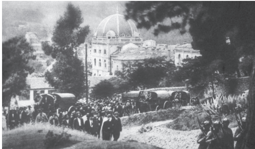
לוויות ההרוגים בהתפרצות האלימה. קונסטנטין, אוגוסט 1934