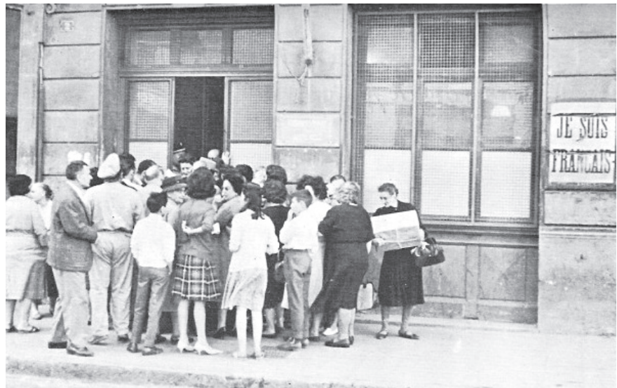
מתיישבים צרפתים בהמתנה לקבלת אישורי היציאה מאלג'יריה. מימין על הקיר כתובת "אני צרפתי". אלג'יר, 1962