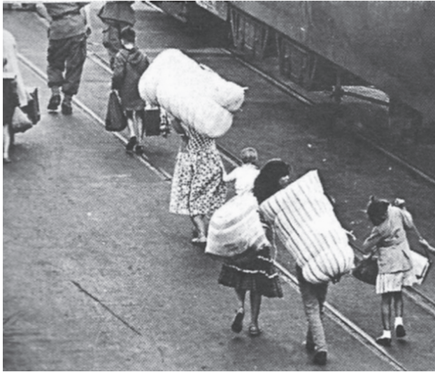
מימין: חיילים צרפתים מכנים מתיישבים צרפתים לקראת עזיבתם את אלג'יריה, 1962 משמאל: הצרפתים יוצאים מאלג'יריה, 1962