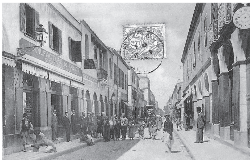
אנשים מתקבצים בפתח בית החרושת לטבק של משפחת שושן שברחוב אלג'יר. בלידה, 1905

צו כרמיה היה השינוי המשמעותי ביותר בקרב יהודי אלג'יריה מאז הכיבוש הצרפתי. משמעותו הייתה פתיחת האפשרות להיטמעות מלאה של היהודים בחברה הצרפתית באלג'יריה ולא רק בתרבותה. בד בבד צו כרמיה ניתק באופן רשמי, ואט אט גם באופן