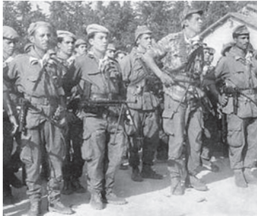
קבוצת לוחמי פל"ן במהלך מלחמת אלג'יריה