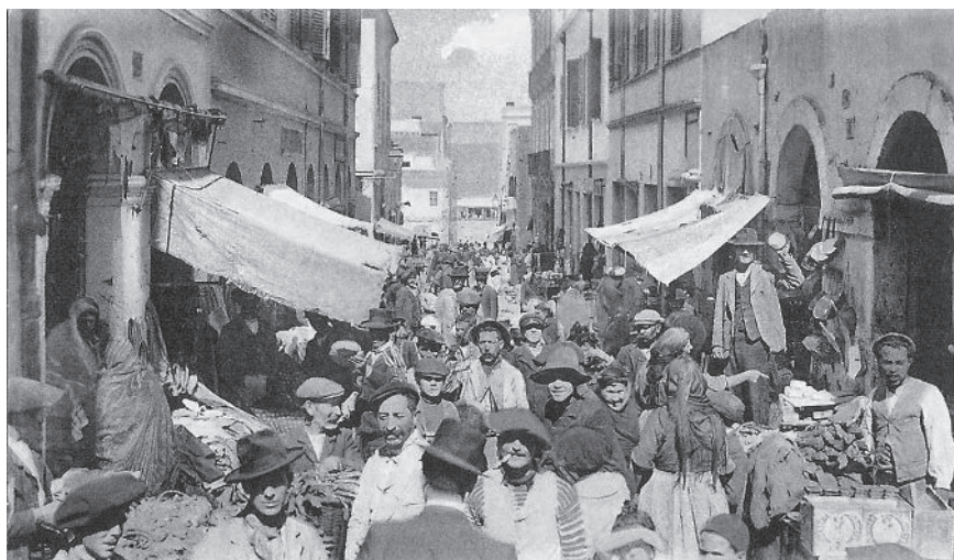
מפגש בין־אנשי ברחוב אוסטרליץ, הרובע היהודי. אוראן, 1906

באלג'יריה בעת החדשה התנהלה מערכת היחסים בין היהודים לבין סביבתם בשלושה מוקדים: היהודי, הצרפתי והמוסלמי. מערכות היחסים היהודית-הצרפתית, היהודית-המוסלמית והצרפתית-המוסלמית היו מורכבות מאוד ויצרו איזונים עדינים. על אף אירועים קשים ביחסי היהודים וסביבתם, מצבם של היהודים באלג'יריה לאורך רוב שנות הקולוניאליזם הצרפתי היה טוב באופן יחסי. ההתיישבות הצרפתית הניכרת, מעמדם של הצרפתים ואופייה הפוליטי והחברתי של החברה הצרפתית יצרו מוקד יחסים נוסף בין היהודים לבין סביבתם; אך הוא היה בעל פוטנציאל פגיעה קשה יותר ממוקד היחסים בין יהודים למוסלמים. אכן, גם בארצות אסלאם אחרות תחת שלטון קולוניאלי היו מערכות יחסים בין יהודים לבין החברה הקולוניאלית, אך היחסים באלג'יריה היו משמעותיים יותר. הנה כי כן, מערכות היחסים של היהודים עם סביבתם באלג'יריה התנהלו בשני מישורים: האחד בין היהודים ובין חברת הרוב המוסלמית – מערכת זו התאפיינה ברגיעה יחסית, אם כי הייתה מתיחות לטנטית בסיסית לאורך כל התקופה; האחר בין היהודים ובין החברה הקולוניאלית הצרפתית – מערכת זו התאפיינה בגלי אנטישמיות קשים כנגד היהודים, ושיאם היה בחוקי הגזע של וישי במלחמת העולם השנייה. בפרק זה אנסה להתחקות אחר מערכות היחסים האלה בציר הזמן שמראשית הכיבוש ועד לעצמאות אלג'יריה. המחקרים בתחום זה באלג'יריה, והם אינם מעטים, בדרך כלל מצביעים על החריג, על הפגיעה בקבוצה זו או אחרת; ואילו המחקר על הדו־קיום ועל מערכות היחסים הסימביוטיות באלג'יריה, כמו בארצות אחרות, בדרך כלל בטל בשישים. מגמה זו במחקר מסיטה את מיקוד הדיון לחריג, ליוצא דופן, לפגיעה ביהודים, ולפיקח התמונה בהיבטים אחרים אינה מאוזנת.