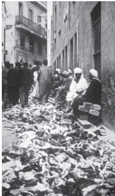
הערבים כוזזים את השכונה היהודית. קונסטנטין, אוגוסט 1934

מה מלמדת ההתפרצות על היחסים שבין היהודים לבין הצרפתים? העובדה העיקרית היא שהשלטונות הצרפתיים לא הצליחו למנוע את האירועים, ובמהלכם לא עשו די, אם לנקוט לשון עדינה, כדי לעצור את הפגיעות ביהודים. אמנם הצרפתים מינו ועדת חקירה לבדיקת האירועים, ובסוף החקירה הטילה הוועדה את כל האשמה על המוסלמים וחיפתה על חוסר האונים של הצרפתים. היהודים כמובן דחו את מסקנות הוועדה. היו בהם אף שהאשימו בגלוי את הצרפתים שהיו מעוניינים בהתפרצות האלימה כדי להסיט את מערכת היחסים המורכבת שבינם לבין המוסלמים לכיוונים אחרים. זאת ועוד, הם סברו כי ההתפרצות האלימה תהיה הזדמנות לפגוע בתנועה הלאומית האלג'ירית ולדכאה. עם