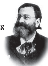
אדואר דרומון (1844-1917)

עיתונאי וסופר צרפתי. תועמלן, אידאולוג ואחד הפעילים הבולטים ביותר בתנועה האנטישמית בצרפת. במחצית השנייה של המאה התשע-עשרה. התפרסם בזכות ספרו La France Juive (צרפת היהודית) (1886), שזכה לתהודה מידית ורחבה מאוד בצרפת. עד 1945 הודפסו מאתיים מהדורות של הספר. ב-1892 ייסד את העיתון La Libre Parole (המילה החופשית) וכתורת המשנה שלו הייתה "צרפת לצרפתים". ב-1889 הקים את "הליגה האנטישמית הצרפתית", וב-1898, כתוצאה מהמערכה האנטישמית שניהל, נבחר לפרלמנט לשמש ציר של העיר אלג'יר. הוא עמד בראש קבוצה אנטישמית של עשרים ושמונה צירים שפעלו בין היתר לביטול צו כרמיה.