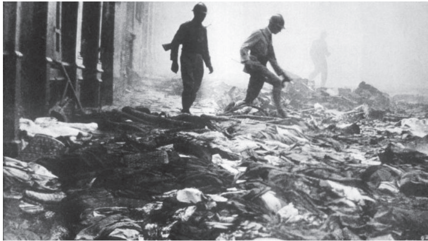
חיילים צרפתים במהלך ההתפרצות האלימה. קונסטנטין, אוגוסט 1934

זה, למיטב הבנתי וידיעתי, לאירועים אלו לא הייתה השפעה על תהליך ההתבוללות של היהודים בתרבות הצרפתית. לעניות דעתי הסברו של שנער הוא הקרוב ביותר למציאות. אביא את דבריו בלשונו: