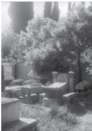
חלקת קברים של קרבנות ההתפרצות האלימה. קונסטנטין, אוגוסט 1934

שני יסודות מאפיינים את תפיסתו של שנער. האחד נוגע לחד-פעמיות של האירוע. ואכן, בתולדות יהודי אלג'יריה בתקופה הקולוניאלית אין דוגמה נוספת להתפרצות מסוג זה – מכאן שיש לראות בה תופעה חריגה ולא תופעה המאפיינת את יחסי היהודים עם סביבתם. השני, עצמת הפגיעה ביהודים מלמדת כי מתחת לפני השטח היחסים נראים פחות איתנים ממה שהם נראים על פני השטח – הם שבריריים, וכל אירוע חריג, דוגמת זה, יכול להביא לשינוי משמעותי.