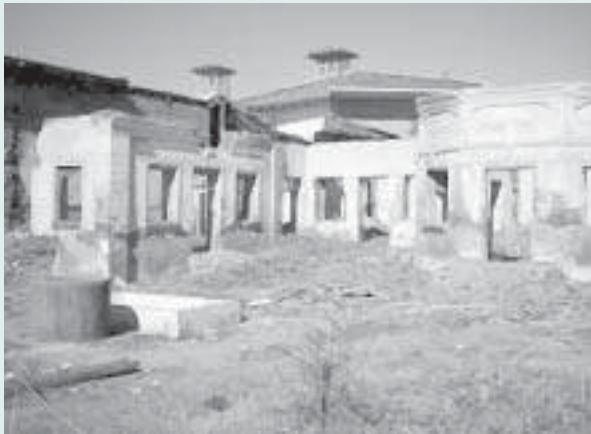
הרס מקדש בהאי, בָּאבֵל (בָּאָךְ פִּירוּשׁ), איראן, 2004

את ספר הקודש החשוב שלו אלכתאב אלאקדס (הספר הקדוש ביותר, 1873 לערך), שבו הציג משנה מוסרית, פילוסופית ומשפטית סדורה אשר על פיה יתנהלו חיי הפרט והקהילה. הוא ביקר פעמים מספר בחיפה והצביע על המקום שבו ייטמנו שרידי גופתו של הבאב, אשר המאמינים שמרו מאז 1850. כמו כן התנבא שכמותו יוקם המרכז העולמי שינהל את ענייניה של הדת החדשה; וכך אכן הווה. במקום שקבע הוקם בניין אבן גדול ובו נטמן הבאב בשנת 1909. מעל לבניין זה, ומבלי לפגוע בו, נשלמה ב־1953 בנייתו של ההיכל הגדול והמרשים בעל הכיפה המוזהבת, שנעשה לכעין סמל העיר חיפה.