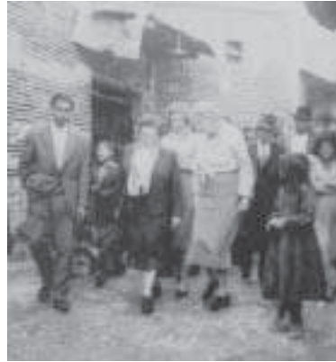
ביקורה של הגברת אלינור רוזוולט ובתה מטעם הג'וינט במחלה בשיראז, 1959

אשת נשיא ארצות הברית, פרנקלין ד' רוזוולט (1882-1945, נשיא בשנים 1933-1945). הייתה אישיות פוליטית וציבורית מרשימה. בין היתר הייתה חברה בבית הנבחרים של מדינת ניו יורק, ונציגת ארצות הברית באומות המאוחדות. פעלה בנושא זכויות האדם.