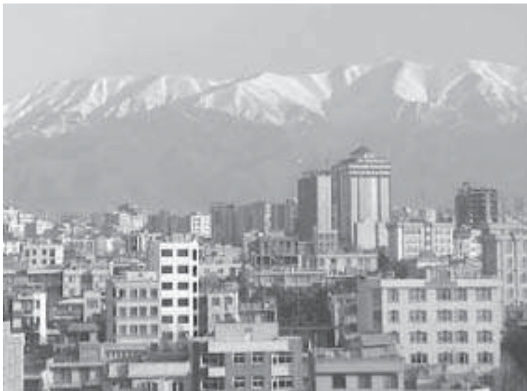
טהראן, על רקע הרי אלבֶרֶז, 2005

טהראן הוכרזה לבירת איראן במארס 1786 בידי מייסד השושלת הקאג'ארית, אקא מחמד כיאן קאג'אר. היהודים החלו להתיישב בטהראן כבר מאמצע המאה השמונה-עשרה; רובם היגרו אליה מיישובים קרובים, במיוחד מדמאונד ומגיליארד. מכאן שהקהילה היהודית בטהראן היא כבת 250 שנה, חדשה מאוד יחסית לקהילות יהודיות ותיקות כמו אצפי'האן, שיראז והמדאן, הטוענות לוותק של 2,500 שנה לפחות. מאמצע המאה העשרים הייתה הקהילה היהודית בטהראן הגדולה ביותר בין הקהילות היהודיות.